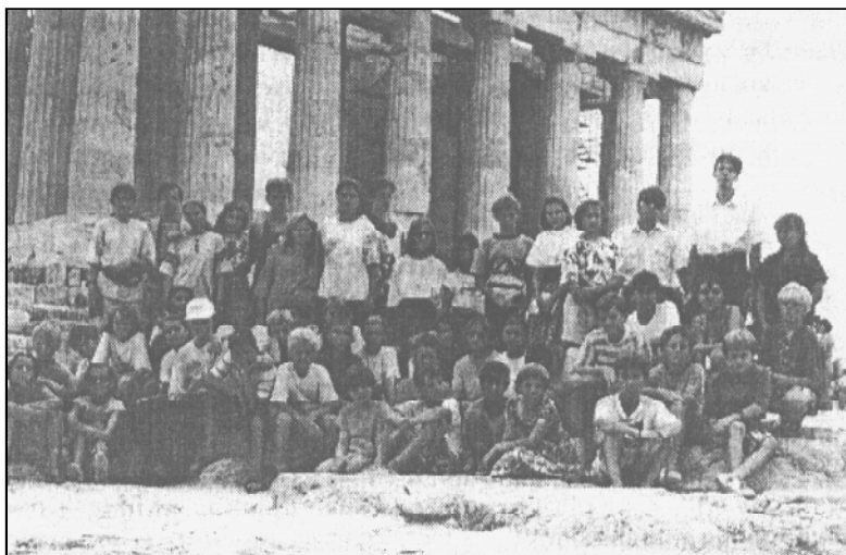
Účastníci zájazdu v Aténach na Akro- pole.

V dňoch 26. júla - 23. augusta 1994 Bratstvo pravoslávnej mládeže na pozvanie Gréckej pravoslávnej cirkvi, v zastúpení otca Nifona, duchovného korintskej eparchie, uskutočnilo zájazd do Grécka.