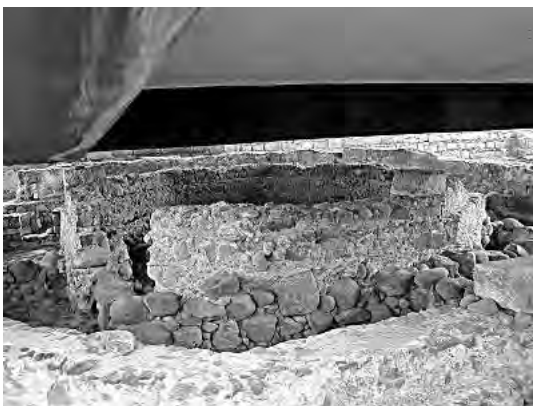
Základy Petrovho domu

Christos uskutočňoval svoje veľké misijné cesty. 6 Isus tu často kázal v synagóge a povolal colníka Matúša za apoštola (Mt 9, 9-13; Lk 5, 27-32). Žiaľ, jeho obyvatelia nečinili pokánie a Isus Christos oznámil jeho úplne zničenie. Sú tu len rozvaliny a zbytky synagógy (Mt 11, 23). Nachádza sa tu aj pravoslávny monastier. 7 Vďaka vytrvalej práci archeológov v 19. a 20. storočí Kafarnaum nezostal len mestom spomínaným v Biblii, ale rozvinul sa na nové moderné mesto, 8 dnes mesto Tell-Chum alebo tiež Tell-Hum (arabský ekvivalent židovského názvu je Tanhum) 9 .