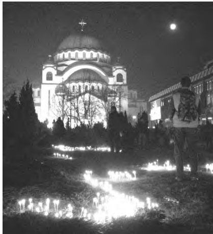
Chrám svätého Sávu, Belehrad modlitby za Kosovo

Preto, keď veríme v Boha a slúžime Mu, máme tiež veriť vo svätú Cirkev a slúžiť Jej, t. j. milovať ju, ako svätú Matku: „Verím v Jednu, Svätú, Katolícku (Všeobecnú) a Apoštolskú Cirkev“ (9. článok Symbol viery). Cirkev nie je nič iné, ako spoločenstvo. Spoločenstvo ľudí, ktorí pravoslávne veria, na čele s biskupmi (Sk 20, 28), usmerňované svätými Tajinami. Alebo jednoduchšie povedané: Cirkev je spoločenstvo ľudí smerujúcich k spásu. Cirkev zotrva nechvejnou a nepremožiteľnou do druhého príchodu Christa, hoci proti Nej bude bojovať všetka moc diabla (Mt 16, 18), pretože je vždy posilňovaná blahodätou svätého Ducha a Isus Christos ju neviditeľne cez pastierov (biskupov) spravuje ako Kormidelník a riadi Ju ako Jej Hlava (Ef 1, 22). Cez Cirkev sa na zemi uskutočňuje dielo spasenia ľudí. Cirkvi v osobe pastierov sú zverené kľúče Kráľovstva Nebeského, Jej je daná Božská moc zadržiavať a odpúšťať hriechy (Mt 18, 18). Cirkev ochraňuje v čistote evanjeliové učenie od heréz a rozkolov. Uchováva v nemenlivosti Tajiny, zachováva rôzne prikázania ako napr. o modlitbe, o sviatkoch, o pôstoch atď. Preto sa svätá Cirkev nazýva stĺpom a základom pravdy (1Tim 3, 15). Preto iba v nej, v rozbúrenom mori života, ako v Noemovom korábe je možné získať spasenie (1Pt 3, 21). Prostriedkami spasenia v Cirkvi je poslušnosť voči Nej (Mt 18, 17) a potom Bohom ustanovené tajomstvá, bez ktorých niet spasenia.