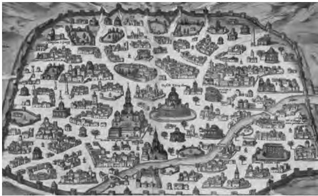
Mapa mesta Damask

Na začiatku 4. tisícročia pred Christom existovalo mestské centrum na Tell as – Salíja, juhovýchodne od dnešného mesta. Ďalej bola tiež objavená keramika datovaná do 3. tisícročia pred Christom, a to v Starom meste; existujú aj dôkazy o zavláďovaní