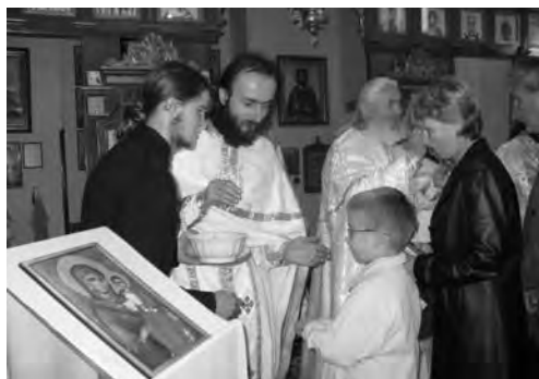
Chrámový sviatok v Nižnej Polianke

o to záujem, nezaujíma ho, čo je pravoslávie, ako učí, ako žije, ako svätá a čisto miluje dušu človeka. A čo bude s dušou človeka, ak zradí? Ak to bol človek, ktorý poznal a zažil pravoslávie a predsa zradil, podľa slov svätého Serafima Sarovského a celej Svätej Tradície, určite nemôže byť spasený. Ak ho však nepoznal a nezažil, ostáva len dúfať, že to nebolo z ľahostajnosti a nezájmu, ale iba z ním nezavinenej slabosti a zlých podmienok a nádejať sa na veľké Božie milosrdenstvo.