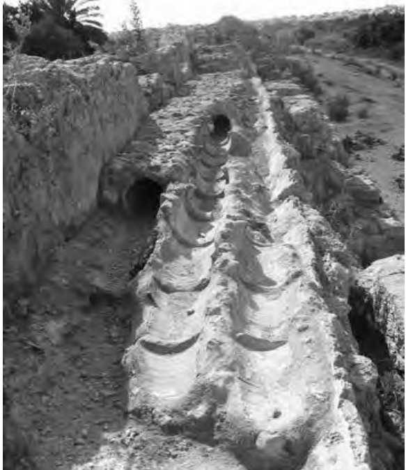
potrubie v akvadukte ktoré privádzalo pitnú vodu

sa tu usadil 9 a prijal aj apoštola Pavla s Lukášom, keď išli do Jeruzalema v roku 58. V tomto období bola Cézarea „politickou metropolou Palestíny a sídlom prokurátora.“ 10 Okrem ďalších udalostí, ktoré majú spojitosť s Cézareou ešte aspoň zmienka o tom, že svätý apoštol Pavel tu bol poslaný na súd pred Félixom 11 a dva roky trval jeho pobyt práve v tomto cézarejskom väzení. 12 Obhajoval sa tu pred Festom a Agrippom a napokon na svoju vlastnú žiadosť bol poslaný do Ríma k cisárovi 13, 14