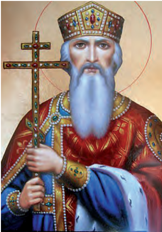
sv. Vladimír Červené Slniečko св. Владимир Червене Слонецко