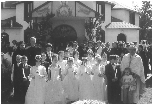
prvá svätá spoveď 2006

My veríme, ako to povedal Isus Christos, že keď budeme mať aspoň takú vieru ako horčičné semienko, ale ak bude pevná ako u apoštolov, keď vyznávali, „že ty si Christos, Syn Boží“,