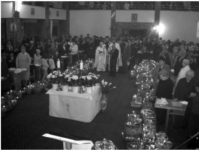
posvätenie paschy, apríl 2007, Košice

Boh dal človeku nielen telo, ale aj dušu. Duša je drahšia ako pokrm a odev. Tak to povedal Isus Christos v evanjeliu o kvetoch a vtákoch. "Preto vám hovorím: Nebuďte ustarostení o svoj život, čo budete jesť, ani o svoje telo, čím sa zaoberáte. Či život nie je viac ako jedlo a telo viac ako odev?"