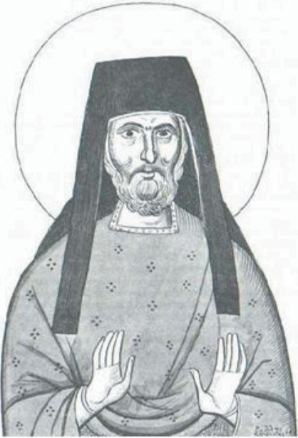
sv. mučeník Georgios Neapolita

Ľud. Ich mená však dávno zotrel čas. Pamiatka svätého kňaza, mučeníka mnícha Georgia, však pretrvala cez priepasť vekov až dodnes a mnohé prípady prosieb, vypočutých na jeho príhovor, jasne svedčia, že on sám stojí živý a oslávený pred trónom Najvyššieho Veľkňaza Christa, ktorého službu ľuďom tak obetavo pripomínal svojim životom. Na jeho svätý príhovor nech nám všetkým Hospodin Boh dá dostatok síl vytrvať i napriek všetkým ťažkostiam vo svojom kňazskom povolani.