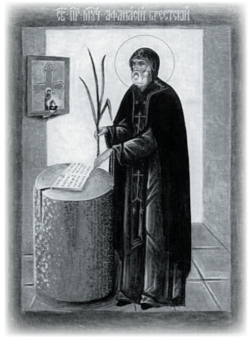
Prepodobnomučeník Afanasij Brestský, obránca Pravoslávia v čase podpísania Brest-litovskej únie

akých sa dopustil, lebo veľa rokov žil medzi pravoslávny gréckeho obradu v Uhorsku, kde ho 370 pravoslávnych duchovných