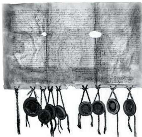
Hramota Brestskej únie podpísaná 8. októbra 1596