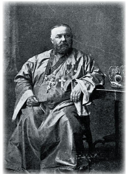
Sv. Alexej Tóth (1854 - 1909) patrón Michalovsko - košickej eparchie, kňaz a obránca pravoslávnej viery rodák zo Slovenska, ktorý sa zaslúžil o návrat tisícov uniátov v USA do Pravoslávnia