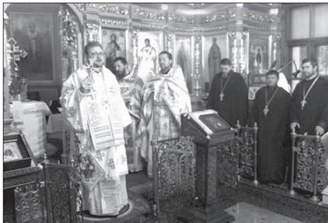
Pamiatka sv. Juraja z Janiny