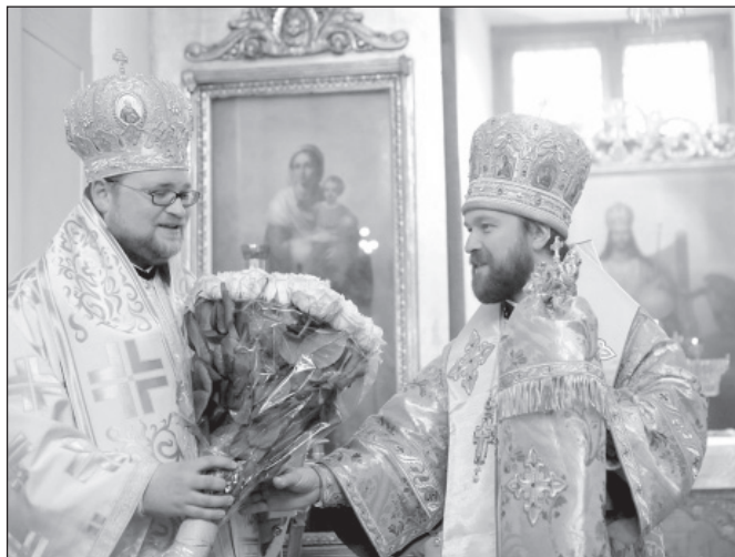
Slávnostná liturgia pri príležitosti 10. výročia biskupského svätenia metropolitu Ilarijona