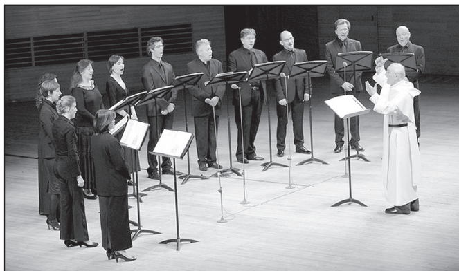
Koncert zboru opátstva Sylvanés