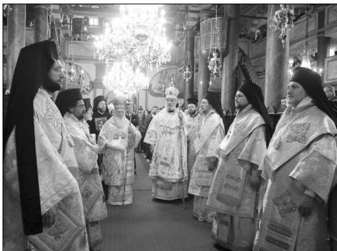
Slávnostná sv. liturgia v katedrále sv. Juraja v konštantínopolskom Fanare – nedeľa 13.5.2012