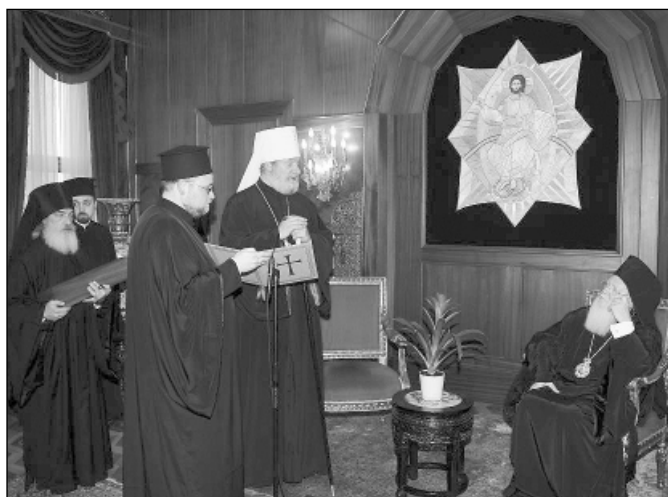
Príhovor metropolitu Kryštofa na patriaršej audiencii