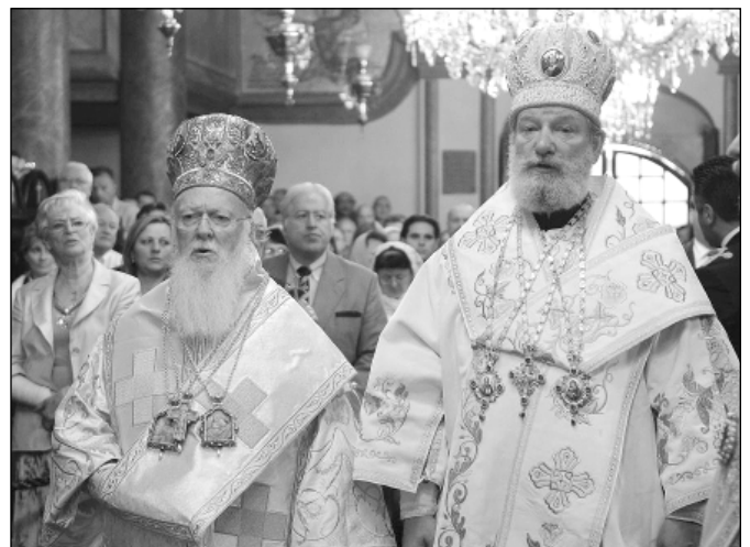
Patriarcha Bartolomej a metropolita Kryštof