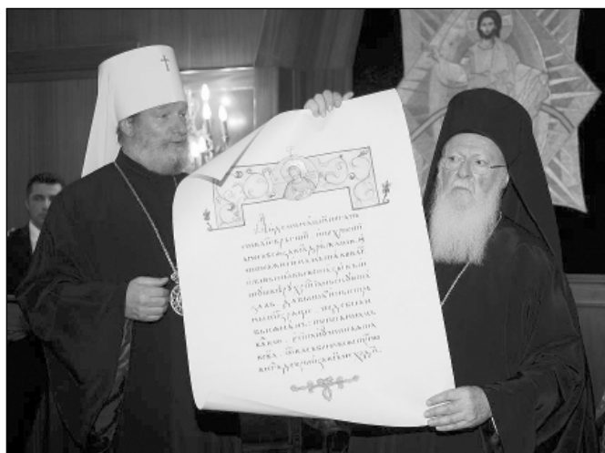
Patriarcha Bartolomej so symbolickou kópiou textu posolstva sv. Rastislava