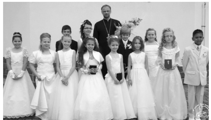
Sv. tajina Pokánia v Michalovciach