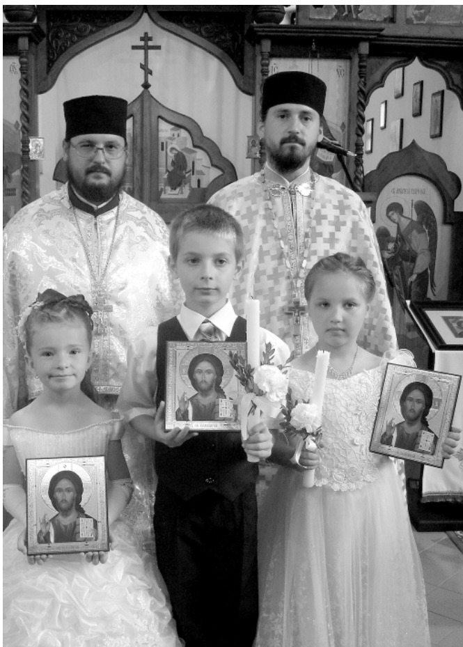
Prvá sv. spoveď v Nižnej Rybnici