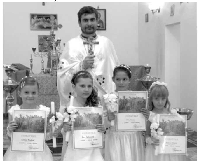
Sv. tajina Pokánia v Sobranciach