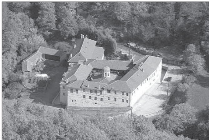
Monastier Matky Božej v Klisure