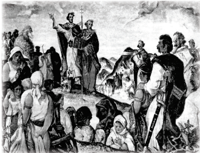
Martin Benka - Príchod sv. Konštantína Filozofa a jeho brata Metoda k Slovákom

Koňuš leží na západnom úpätí Popričného v doline Choňkovského potoka pri štátnej hranici s Podkarpatskou Ukrajinou. V súčasnosti patrí do okresu Sobrance. Sú tu bohaté a listnaté lesy. Obec sa spomína už v r. 1414. V r. 1427 nebola zdanená. Patrila do panstva Michalovce - Tibava. V r. 1715 mala 10 domácností, a v r. 1828 39 domov a 400 obyvateľov. Do 19. stor. boli zemepánmi Tibayovci. Obyvatelia sa zaoberali poľnohospodárstvom, ovčiarstvom a v 18. stor. aj vinohradníctvom. Za