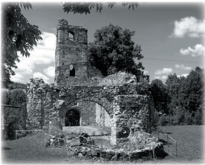
Ruiny monastierského chrámu v Krásnom Brode, kde v r. 1614 došlo k pokusu uzatvoriť cirkevnú úniu s Rómom.