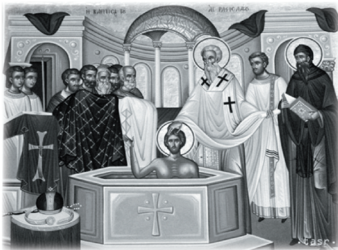
Krst kniežata Rastislava na nástennej malbe v chráme sv. Cyrila a Metoda v Solúne.

Odcitujeme tu slová z epiklézy (privolávanie Sv. Ducha na predložené dary pri premenení) : „ Paki prinosim tebi slovesnú siju i bezkrovnú službu a molim ti sja i molby dijem i prosim i tebe sja molim, posli Duch Tvoj svjatý na ny i na predležašija dary sija. Sotvori ubo chlib sej drahoveje tilo Christa Tvojeho, preloživ Duchom Tvojim svjatým a ježe v čaši sej, drahoju krov Christa Tvojeho, ježe izle sja mirskaho radi spasenija v žizň vičnujú “ -