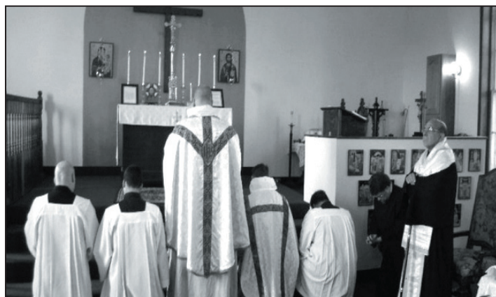
Pravoslávna liturgia slúžená západným rýtom

V prvom rade musíme vyjasniť, čo vlastne je „západný rít“ v Pravoslávii. Cirkev v Británii, takisto ako v Severozápadnej Európe má veľmi dávnu históriu. Sv. Dorotej z Tyru svedčí, že jeden zo 70-tich učeníkov Christa Arystobul prišiel do Británie ako biskup okolo r. 37 po Christovi. Vieme, že Arystobul založil prvé spoločenstvá pozdĺž bristolského kanála na západe Anglicka. To svedčí o tom, že Cirkev v Británii je staršou, než Cirkvi v Grécku, či v Ríme.