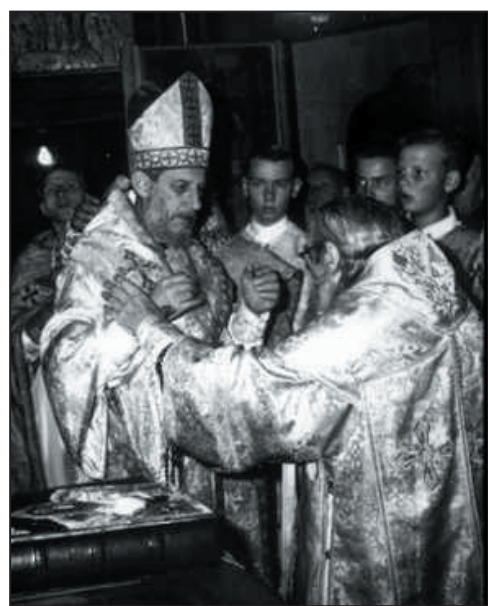
Sv. Ján Maximovič, San Franciský divotvorca, pri chirotonii pravoslávneho biskupa západného rítu

V r. 600 vo veľkom monastieri v Jarrowe na severe Anglicka žil učený mních menom Beda. Vo svojich písomných svedectvách spomína na to, ako sv. biskup Benedikt budoval v monastieri kaplnku. Podľa opisu Bedy, sv. Benedikt umiestnil ikony na stenách, a tiež ikonostas pred oltárom (v ang. jazyku sa ikonostas nazýva Rood Screen). Podobné ikonostasy sú dodnes v mnohých anglických chrámoch. To svedčí o tom, že chrámy v druhej polovici prvého tisícročia v Británii sa nejakým výrazne nelíšili od prvých chrámov na území Rusi.