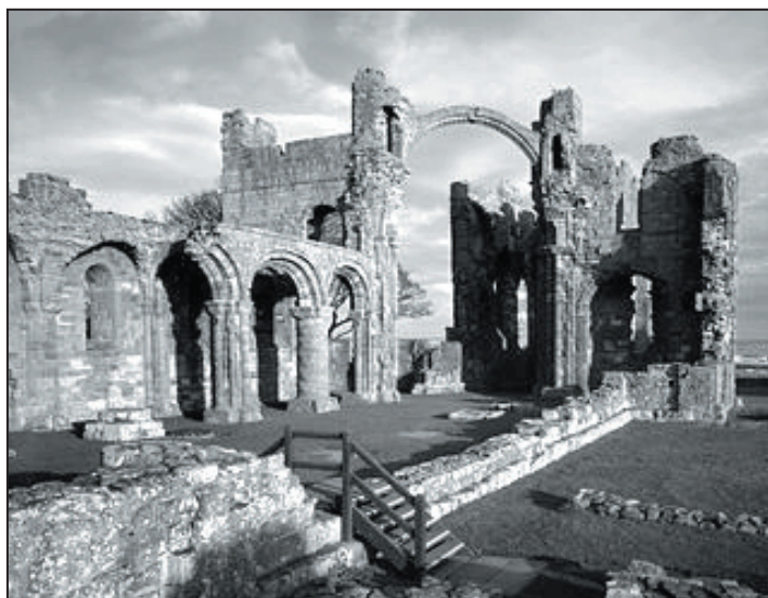
Zrúcaniny opátstva v Lindinsferne (Anglicko)