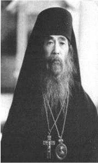
Pravoslávnu misiu zahájil v Japonsku už svätorečený legendárny ruský misionár biskup Nikolaj .

Obrátil pozornosť k čínskej variante. Do Číny prišlo Pravoslávie totiž o niečo skôr. A pretože japonština má niektoré spoločné rysy s čínštinou, ukázal sa tento preklad dobrým východiskom.