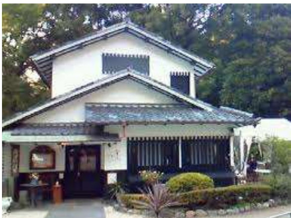
Malý japonský pravoslávny chrám

Samozrejme, že áno. Mnohé základné kresťanské princípy: miluj bližneho svojho; ak ťa niekto udrie po jednom líci, nastav i druhé... To je Japoncom dávno známe a pochopiteľné. Zatiaľ, čo v západnom svete stojí v strede sveta človek a jeho "ja", až na druhom mieste sú potom jeho vzťahy s druhými ľuďmi, tak naopak v myslení Japoncov stoja na prvom mieste práve druhí ľudia. Čiže akési prvky pravoslávneho myslenia sú v nich už zakorenené. Alebo môžeme pripomenúť inú vec: spomínanie zosnulých . V Japonsku ctia pamiatku predkov, takže pravoslávna tradícia zádušných bohoslužieb, panychíd, stolovania prestieraného k ucteniu pamiatky zosnulých - to všetko tu bolo prijaté veľmi rýchlo.