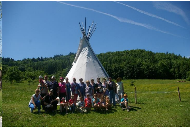
Deň detí na Lunterovom ranči v Kráľovej