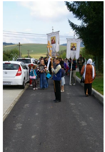
Púť v Ladomirovej v časť pamiatky Sťatia hlavy Jána Krstiteľa, september 2015